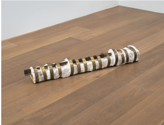
特里·阿德金斯，《呼召》，1987 年作。黃銅、鐵、木材、石膏， 18 x 121 x 18 公分（7 x 47 1/2 x 7 吋）© 特里·阿德金斯。由特里· 阿德金斯遺產提供。攝影：Tom Powel Imaging。

蘇黎世—特里·阿德金斯（Terry Adkins）曾將他改造拾獲之物的創作手法形容為「揭露潛能」，他透過精心鋪排不同的物件，揭示潛在的歷史和比喻聯想。將於 6 月 8 日在蘇黎世藝術週開幕的「實驗物性（Experimenting with Materiality）」展覽，透過阿德金斯、桑妮雅·戈梅斯（Sonia Gomes）、森夏·能古蒂（Senga Nengudi）和卡羅·拉馬（Carol Rama）的跨媒體作品，展示這種為材料重新賦予涵義的手法。這些藝術家雖然創作背景各異，處理物質性的手法卻有共通之處。他們以平凡的物料作為主要媒介，從歷史角度探討有關種族、性別及工業的持續對話。他們的作品採用相似的拼湊技巧，充滿精神主義，讓藝術家能透過將媒介融入超然的整體，成就提升媒介基本特質的藝術。由 Lévy Gorvy with Rumbler 呈獻的「實驗物性」將於蘇黎世首度集合多位大師的重要作品，以頌揚他們極為創新而複雜的創作手法。