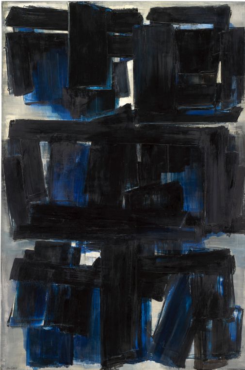
피에르 술라주 <회화 195 x 130 cm, 1957년 10월 30일> (1957). 캔버스에 유채, 195 x 130 cm © 2019 Artists Rights Society (ARS), New York / ADAGP, Paris. National Gallery of Art, Washington, D.C. 제공

뉴욕-레비고비 뉴욕은 프랑스를 대표하는 생존작가 피에르 술라주의 100 세 생일을 기념하여 개인전 <피에르 술라주: 세기(世紀)>展을 개최한다. 2019 년 9 월 5 일부터 10 월 26 일까지 열리는 이번 전시는 1950 년대부터 현재까지 작가의 작업 세계를 총망라한다. 또한 전시는 유럽과 미국 회화 전통 사이 끊임없는 대화 안에서 작가의 중추적인 역할을 되짚으며 오로지 검은색을 주제로 작업해온 그의 급진적이며 시적인 추상 세계를 조명한다.