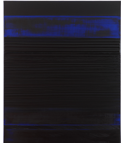
피에르 술라주 <회화 92 x 73 cm, 1989년 2월 27일> (1989). 캔버스에 유채, 92 x 73 cm. © 2019 Artists Rights Society (ARS), New York / ADAGP, Paris. 사진: Elisabeth Bernstein.

피에르 술라주는 70 년이 넘는 긴 시간 동안 성공적인 작가 인생을 펼쳐왔다. 1940 년 당시 뉴욕현대미술관 큐레이터였던 제임스 존슨 스위니(James Johnson Sweeny)는 독특한 도구와 강렬한 검은색 물감으로 작업하는 한 젊은 작가에 대한 이야기를 듣고 술라주의 파리 작업실을 찾았다. 스위니의 지원으로 술라주는 1954 년 뉴욕의 유명 갤러리인 쿠티갤러리(Kootz Gallery)의 전속작가가 되었고 미국에서 빠르게 주목받기 시작했다. 그의 작가인생에서 핵심 전환점이 되었던 그 해를 기념하여 이번 레비고비 전시에는 작가의 <회화 55 x 38 cm, 1954 년 12 월> 이 포함될 예정이다. 검은색, 붉은색, 갈색, 황토색의 물감이 두꺼운 붓질의 격자 형태로 표현된 이 작품은 이 시기의 주요작으로서 미국 컬렉터에게 소장된 이후 그의 가족이 현재까지 65 년동안 소유해 왔다.