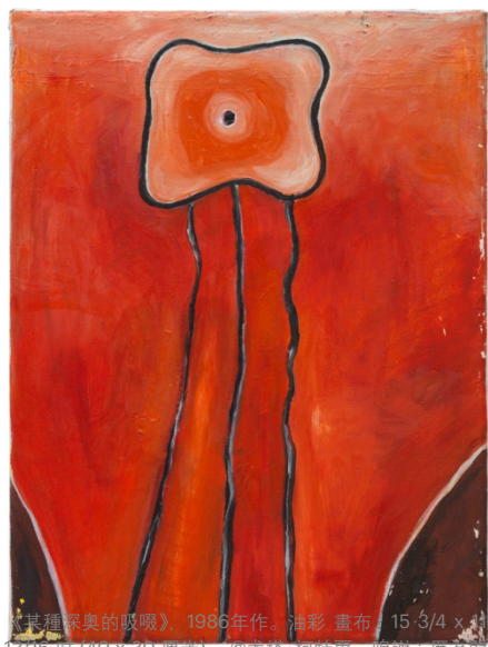
《某種深奧的吸啜》，1986年作，油彩 畫布，15 3/4 x 13 1/16 吋 (40 x 30 厘米)。©尤塔·柯特爾。鳴謝：厲為閣及Galerie Buchholz

展覽二樓以柯特爾早年於科隆的創作為主題，主要介紹貫穿其作品的觀念和結構。這些小型畫作就像祭祀儀式所用的物品或令人迷戀之物，見證了藝術家找尋現代主義標準敘事手法和當時流行的新表現主義模式以外的替代品。作為一位尋找其他方式的藝術家，柯特爾將焦點轉至晦澀隱秘並持有異見的傳統，然後「吸啜」它們，正如是次展出的兩幅畫作《某種深奧的吸啜》(Some Esoteric Sipping, 1986 年作) 所示。作品中的不規則正方形伸出纖維狀的線條，介乎於抽象與具像之間，將畫布變為如肉體起伏的地貌。柯特爾早期的油畫，例如《艾迪》(Edie, 1983 年作) 和《無題》(Untitled, 1984 年作)，強調顏料的物性，在此則呈現為「肉」之隱喻，結集濃厚的厚塗顏料、肌膚的色調和支離破碎的女性身體。這些作品刻意地營造粗獷風格，產生一種空間壓迫感，直至 1980 年代中後期藝術家才改用更淺、更稀薄的顏料。《100% (羅伯特·約翰遜肖像)》(100% (Portrait of Robert Johnson), 1990 年作) 以一系列濃郁的紅色創作，將一張概要的臉孔與一連串名詞和形容詞結合，包括「迷戀 (obsessed)」、「電 (electric)」、「靈性 (spiritual)」、「星際 (astral)」和「氣質 (aura)」。兩幅不協調又充滿力量的雙聯畫彰顯了柯特爾獨特的繪畫方法，她「百分百」地投入這種媒介，並未因為後現代社會所宣告的繪畫之死而卻步。