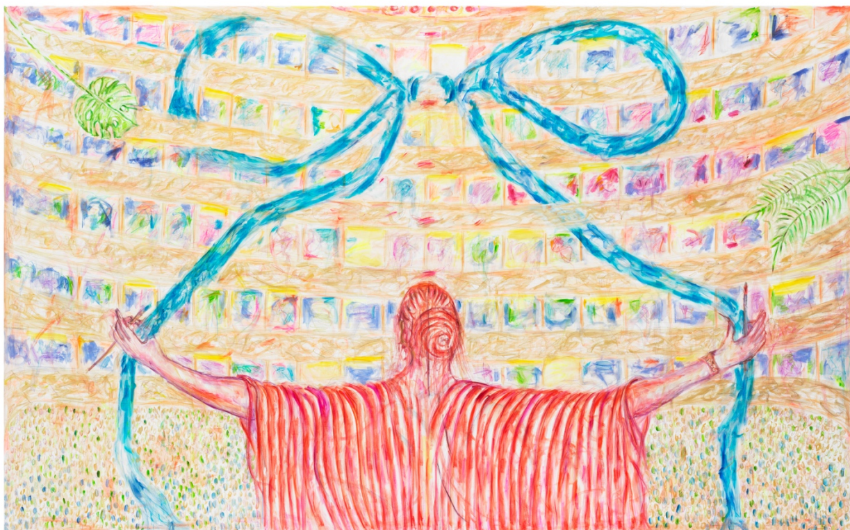
《加演》，2019年作，油彩 畫布，82 11/16 x 133 7/8 吋 (210 x 340厘米)。© 尤塔·柯特爾

紐約——厲為閣欣然呈獻尤塔·柯特爾 (Jutta Koether) 首場展覽，展覽橫跨麥迪遜大道 909 號厲為閣紐約空間三層樓面，匯聚柯特爾的最新畫作和 1980 年代初至 1990 年的精選作品。發問「繪畫的意義」、以及「在當下堅持繪畫的意義」，柯特爾採用了一種多變的作者立場。她深挖那些塑造科隆 80 年代文化的挪用語言，以及她於 1991 年移居紐約後的所見所聞，兼收並蓄，構建的藝術譜系橫跨早期現代透視繪畫至象徵主義、後印象主義和超現實主義。她運用一些反覆出現的意象鋪成用典，包括像素網格、鮮紅的顏料和解開的緞帶等。這些譬喻的含義堅定卻神秘晦澀，承載歷史脈絡的同時也經由每位看到柯特爾作品的觀者重新商議。她投身於媒材的過去與徐徐展露的現在，致力突顯情感、異步與失調，為繪畫開闢出嶄新而全然當代的空間。