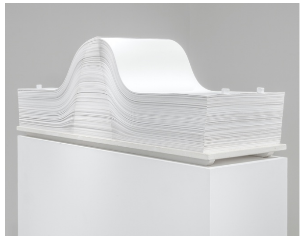
Spartito , 1969/2004. Feuilles de papier et boulons métalliques sur une base en bois, 16 9/16 x 13 3/4 x 47 1/4 inches (42 x 35 x 120 cm). © Enrico Castellani / Artists Rights Society (ARS), New York / SIAE, Rome.

Plusieurs œuvres majeures sont présentées dans cette exposition dont Superficie nera (2006), un rare exemple d'une édition noire de cette série qui reflète l'intérêt de Castellani pour le relief et les jeux d'ombre et de lumière et Superficie argento (2006), une œuvre de neuf panneaux. Ces œuvres en aluminium sont